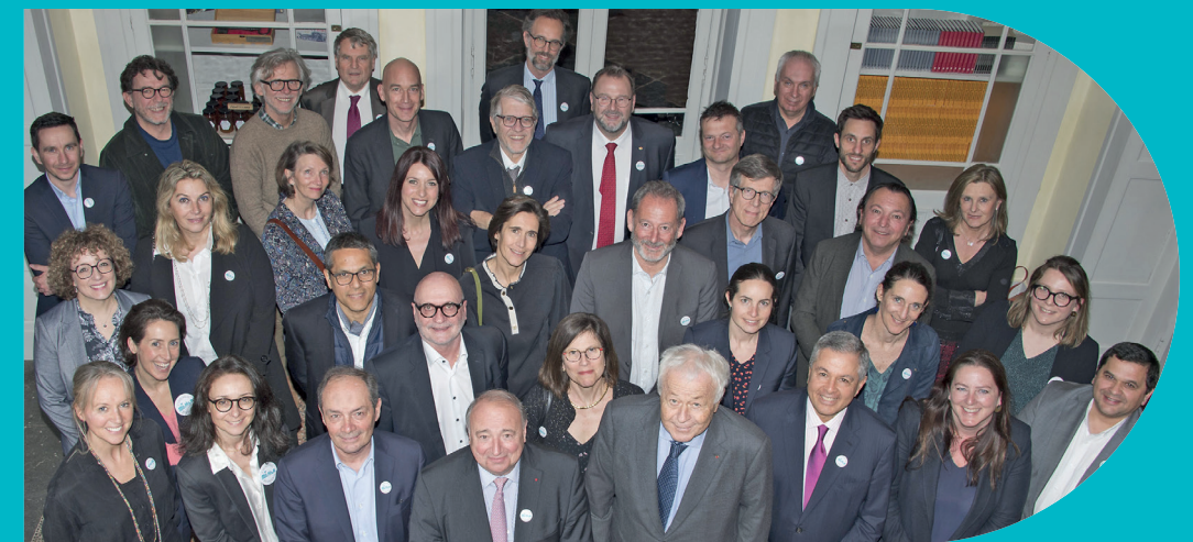
Rencontre du 13 mars 2024